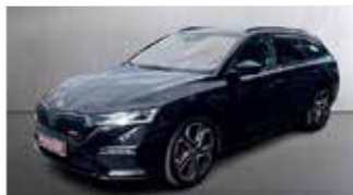
Skoda Octavia 2.0 TSI RS Plus „Automatik - Columbus+“

EZ: 12/2022, 42.946km, Benzin, 180 kW (245PS), Klimaautom., ACC, Standheizung, Sitzheizung vo.+hi.