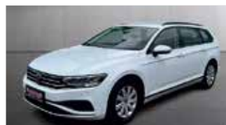
VW Passat Variant 1.5 TSI „Automatik - Kamera - Navi“

EZ 03/2023, 75.650km, Benzin, 110 kW (150PS), Klimaautom., ACC, Sitzheizung, LED, AppConnect, DAB