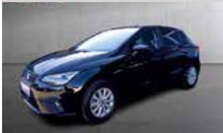
Seat Ibiza Style Voll-LED „Frontassistent - Sitzheizung“

EZ: 01/2023, 39.958km, Benzin, 70 kW (95PS), Carplay, Klimaautom., Licht-&Regensensor, DAB, Touchscreen