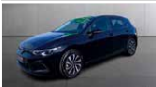
VW Golf 8 Active 1.5 TSI „Sitzheizung - Navi - Kamera“

EZ: 12/2022, 40.971km, Benzin, 110 kW (150PS), AppConnect, LED, HUB, Standheizung, Klimaauto