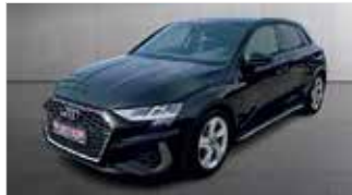
Audi A3 1.5 TSI S-Line S-tronic „Automatik - Navi - Sitzheizung“

EZ: 01/2024, 45.500km, Benzin, 110 kW (150PS), Einparkhilfe hi., ACC, Klima, DAB, Licht-&Regensensor