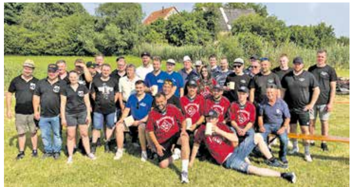
Gruppenbild aller teilnehmenden Mannschaften beim Hirschbrunner Stammtisch-Jubiläum.