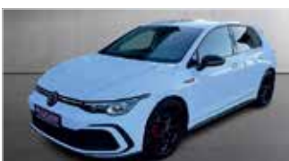
VW Golf GTI 2.0 TSI Black Style „Automatik - Kamera“

EZ: 11/2023, 37.450km, Benzin, 180 kW (245PS), Sitzheizung, LED, Klimaautom., Verkehrszeichenerk.