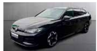
VW Passat Variant 2.0 TDI R-Line „Automatik - Matrix - Teilleder“

EZ 03/2025, 56.650km, Diesel, 110 kW (150PS), Klimaautom., ACC, Alarmanlage, Sitzheizung, AppConn.