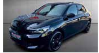
Opel Corsa GS „Navi - Sitzheizung - Kamera“

EZ: 08/2024, 21.450km, Benzin, 74 kW (101PS), Klimaautom., LED, AppConnect, Lenkradheizung