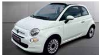
Fiat 500C Cabrio Club „AppConnect - Tempomat“

EZ: 01/2023, 73.850km, Benzin, 52 kW (71PS), Einparkhilfe hi., DAB, Klima, el. Fensterheber