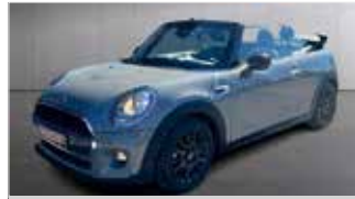
Mini Cooper D Cabrio Pepper „Navi - Sitzheizung“

EZ: 07/2016, 84.650km, Diesel, 85 kW (116PS), Klimaautom., LED, Einparkhilfe hi+vo, Licht-&Regensensor