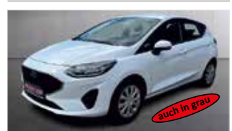
Ford Fiesta Cool & Connect „Navi - LED - APPConnect“

EZ: 04/2022, 58.350km, Benzin, 74 kW (101PS), Klima, Lichtsensor, Tempomat, Bluetooth, Touchscreen