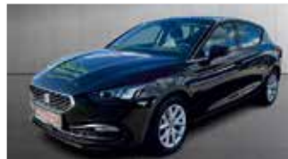
Seat Leon Style 2.0 TDI „Navi - LED - AppConnect“

EZ: 06/2022, 87.450km, Diesel, 110 kW (150PS), Einparkhilfe vo.+hi., Sitzheizung, Klimaautom., Heckrollto