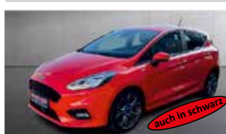
Ford Fiesta ST-Line „Navi - Sitzheizung - Keyless“

EZ: 09/2021, 65.250km, Benzin, 74 kW (101PS), Klimaautom., DAB, Lenkradheizung, Frontscheibe beheiz.