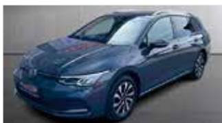
VW Golf 2.0 TDI Variant Active „Automatik - Sitzheizung - Navi“

EZ 01/2023, 58.850km, Diesel, 110 kW (150PS), Klimaautom., ACC, Light Assist, Lenkradheizung, DAB