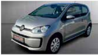
VW up! „Klima - Kamera“

Industriestraße 10 -> 96138 Burgebrach Tel. 09546/594099-0 www.dieautoidee.de