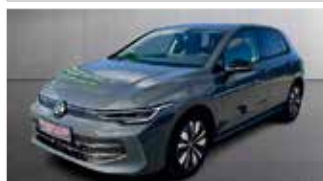
VW Golf 1.5 eTSI Goal „Navi - Sitzheizung - Automatik“

EZ: 01/2025, 33.250km, Benzin, 85 kW (116PS), Lenkradheizung, ACC, Klimaautom., Lenkradheizung, LED