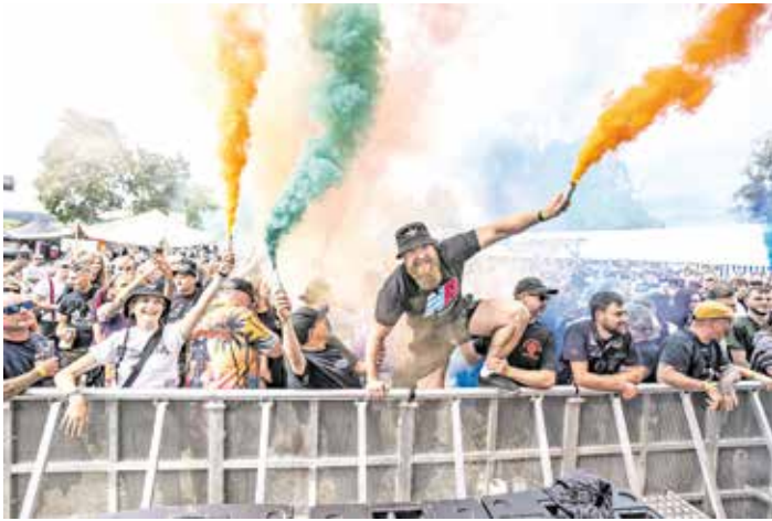
Prölsdorf. Im Steigerwald feiert das beliebte Festival „Krach am Bach“ vom 9. bis 11. Juli 2026 sein 20. Jubiläum und verabschiedet sich damit gleichzeitig von seiner Fangemeinde.

Prölsdorf. Das 20-jährige Jubiläum des Krach am Bach-Festivals wird vom 9. Bis 11. Juli 2026 am Sportgelände in Prölsdorf stattfinden. Im Laufe der Jahre entwickelte sich das Festival im beschaulichen 300-Seelen-Örtchen zu einer Open Air Institution weit über den Steigerwald hinaus und wird sicherlich ein weiteres Mal Musikfans aus der gesamten Republik und dem näheren Ausland in den Rauhenbracher Ortsteil pilgern lassen. Die diesjährige Ausgabe stellt auch gleichzeitig den Abschluss und die letzte Version des beliebten Festivals dar. Seit 2006 organisiert der heimische SC Prölsdorf das gemeinnützige Musik-