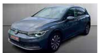
VW Golf Active „IQ-Drive - HUD - Standheizung“

EZ: 01/2023, 54.250km, Benzin, 110 kW (150PS), Sitzheizung, Kamera, Klimaautom., ACC, AppConnect, DAB