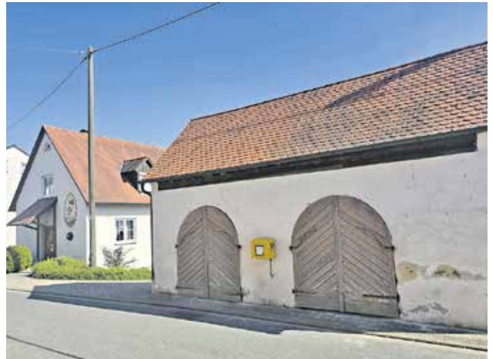
Alte Viehwaage in Oberköst wird ertüchtigt.