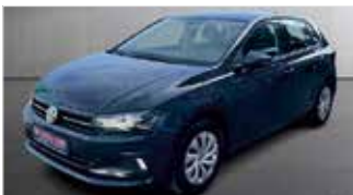
VW Polo 1.0 TSI Comfortline „Sitzheizung - Tempomat“

EZ: 02/2020, 70.950km, Benzin, 70 kW (95PS), Klima, Bluetooth, USB, Einparkhilfe vo.+hi., el. Außenspiegel