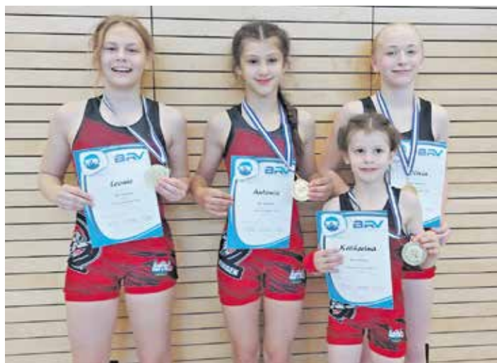
Die Teilnehmerinnen am Team Cup Bayern in Feldkirchen.

Am gleichen Tag fand im oberbayerischen Feldkirchen der Team Cup Bayern für die Schülerinnen, weibliche Jugend und Frauen statt. Teilnahmeberechtigt beim