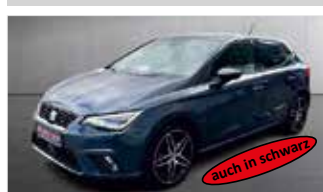
Seat Ibiza FR Pro „Navi - Kamera - Sitzheizung“

EZ: 11/2022, 14.250km, Benzin, 81 kW (110PS), Verkehrszeichenerk., Beats, Klimaautom., ACC, AppConnect