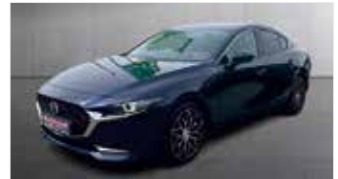
Mazda 3 2.0 SKYACTIV-X „Selection - Matrix - Bose“

EZ: 07/2020, 47.850km, Benzin, 132 kW (179PS), Einparkhilfe vo.+hi., Sitzheizung, Klimaautom., ACC, HUD