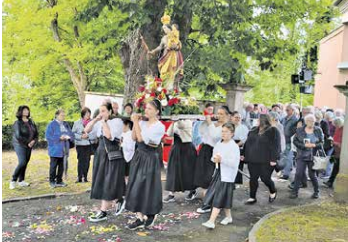
Große Blutsprozession mit den Trägerinnen der Heiligenfiguren.