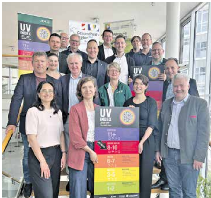
Übergabe der UV-Index-Tafeln an die Gemeinden.

Je höher der UVI, desto mehr Sonnenschutz ist notwendig. Bereits ab einem UVI von 3 (mittel) braucht die Haut Schutz. Vorrang haben Schatten und geeignete Kleidung, für unbedeckte Hautstellen empfiehlt sich zusätzlich Sonnencreme. Wer sich im Schatten aufhält, kann die UV-Strahlung um etwa 50 Prozent vermindern. Dichtes Blattwerk von Bäumen oder Sträuchern ist dazu besser geeignet als die meisten Strandschirme. Bei der Kleidung gilt: Sie schützt gut, wenn sie dunkel, fest gewebt oder dicht und ungebleicht ist und Schultern, Nacken und Dekolleté bedeckt. Es gibt auch Kleidung mit speziellem UV-Schutz. Sinnvoll sind außerdem Kopfbedeckungen mit breiter Krempe und Sonnenbrillen, um die Augen zu schützen.