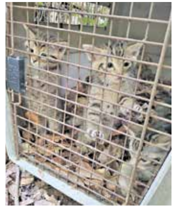
Die drei Kätzchen in der Transportbox wollen raus in die Natur.

Landkreis Bamberg. Alles begann mit einer Verwechslung: Tief im Wald bei Priegendorf entdecken zwei Frauen drei Kätzchen und halten sie für ausgesetzte Hauskatzen. Was sie nicht wissen: Mehrere Waldgebiete in der Region sind inzwischen wieder von Wildkatzen besiedelt. Die Hunde der Frauen hatten den Nachwuchs einer Wildkatzenmutter aufgespürt. Die Jungtiere waren keineswegs hilfsbedürftig. Da sich junge Wildkatzen und graugetigerte Hauskatzen optisch kaum unterscheiden, werden die Tiere trotz heftiger Gegenwehr mitgenommen. Über Umwege gelangen sie ins Tierheim Bamberg.