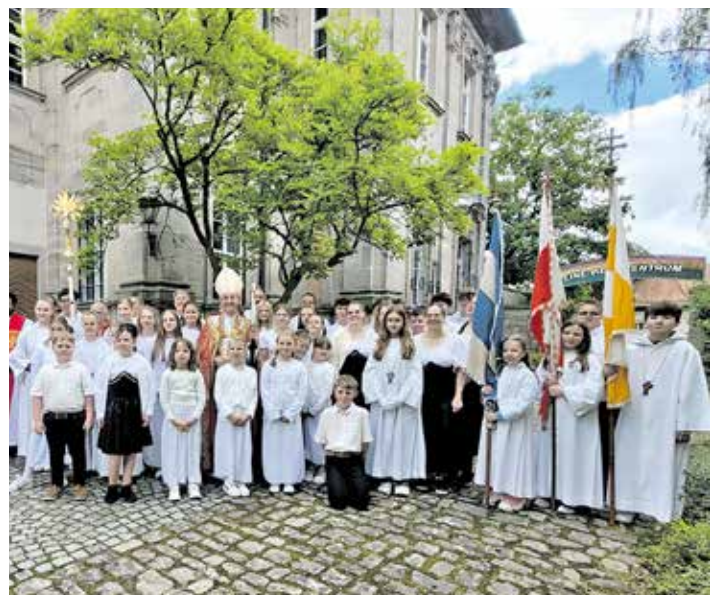
Erzbischof em. Ludwig Schick mit kirchlichen Mitgestalterinnen und Mitgestaltern des Heilig-Blut-Festes vor dem Schloss in Burgwindheim.

Der Markt Burgwindheim dankt allen ehrenamtlichen Helferinnen und Helfern, allen Mitwirkenden sowie den Besucherinnen und Besuchern für das wundervolle Fest und freut sich auf alles, was die Auszeichnung des „Immateriellen Kulturerbes“ mit sich bringt.