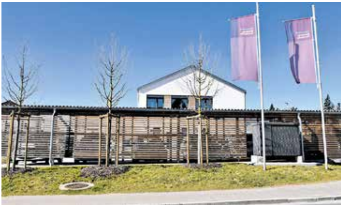
Die Tagespflege Drei-Franken-Eck der Diakonie Bamberg-Forchheim öffnet im Rahmen des Winkelmarkts in Schlüsselfeld ihre Türen und lädt u.a. zu einer besonderen Ausstellung ein.

die Ausstellung „Erzähl doch mal von früher“ offiziell eröffnet. Auf großen Tafeln erinnern sich die Tagespflege-Gäste zum Beispiel ans Schwarzbeer-Pflücken in ihrer Kindheit, vergleichen u.a. die Konfirmation heute und früher und verraten, was sie rückschauend tun würden, wenn sie noch einmal 20 Jahre alt wären. Die Ausstellung ist ein Teil der Biografiearbeit, die die Diakonie-Mitarbeitenden in der Tagespflege mit den Senioren umsetzen. Ab 14:15 Uhr spielt auch die Schlüsselfelder Blasmusik auf.