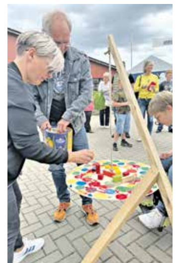
Bei einem Geschicklichkeitsspiel war Teamarbeit gefragt: Gemeinsam versuchten die Gäste, die Waage im Gleichgewicht zu halten.

und informierten über ihre Arbeit. Ergänzt wurde das Angebot durch verschiedene externe Anbieter, die mit ihren Ständen zum vielfältigen Charakter des Sommerfestes beitrugen. Bei Führungen durch die Werkstätten konnten Gäste und Angehörige zudem einen Blick hinter die Kulissen werfen und mehr über die Herstellung der Produkte sowie die tägliche Arbeit in der Einrichtung erfahren. Das Sommerfest bot den Bewohnerinnen und Bewohnern sowie ihren Familien die Möglichkeit, gemeinsam Zeit zu verbringen, neue Begegnungen zu erleben und die Gemeinschaft der Einrichtung zu feiern. Die hohe Besucherzahl und die durchweg positive Resonanz machten deutlich, welchen Stellenwert die Veranstaltung für die Menschen der Barmherzigen Brüder und darüber hinaus besitzt.