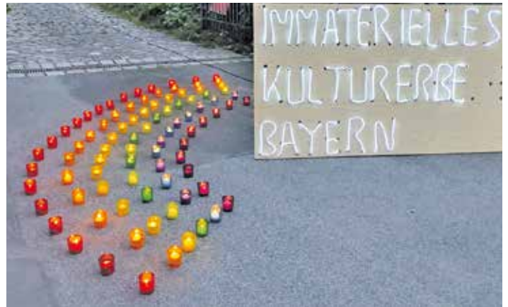
Große Lichterprozession: Ein Bild im Zeichen des immateriellen Kulturerbes.