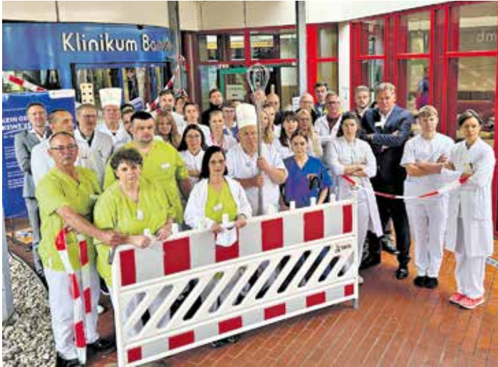
Vertreterinnen und Vertreter der verschiedenen Berufsgruppen versammelten sich vor dem symbolisch abgesperrtem Haupteingang des Klinikums Bamberg.

Bamberg. Am 12. Juni 2026 riefen die Krankenhausgesellschaften in Bayern und Baden-Württemberg zum Süddeutschen Klinikprotest auf. Anlass waren das geplante GKV-Beitragsatzstabilisierungsgesetz und die damit einhergehenden Sparvorschläge der Bundesregierung, die viele Kliniken in einer wirtschaftlich schwierigen Zeit noch zusätzlich unter Druck setzen. Im Rahmen des Protests waren die Kliniken dazu aufgerufen, ihre Haupteingänge zu verschließen und Besucherinnen und Besucher auf die Nebeneingänge zu verweisen. Auch das Klinikum am Bruderwald sperrte seinen Haupteingang von 11:00 bis 12:00 Uhr symbolisch ab. „Die Gesundheitsversorgung in Deutschland ist nicht mehr zeitgemäß und bedarf dringend einer Verbesserung. Deshalb begrüßen wir die bereits beschlossene Gesundheitsreform“, so Martin Wilde, Vorstandsvorsitzender der Sozialstiftung Bamberg. Mit dem jetzt neu vorgelegten GKV-Beitragsatzstabilisierungsgesetz will die Bundesregierung kurzfristig ein Spargesetz beschließen. Der aktuelle Gesetzesentwurf würde die Kliniken in Deutschland finanziell sehr stark belasten, die Bürokratie um ein Vielfaches erhöhen und die guten Ansätze der notwendigen Gesundheitsreform gefährden. Das GKV-Beitragsatzstabilisierungsgesetz sehe unter anderem vor, dass die Tarifierhöhungen der Beschäftigten nicht mehr vollständig ausgeglichen werden. Da die Erlöse in den Kliniken gesetzlich