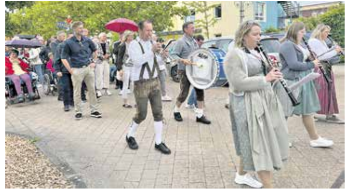
Die Blaskapelle Gremsdorf sorgte während des Festumzugs und im Festzelt für die musikalische Unterhaltung.

Mit Gottesdienst, Festumzug und Familienprogramm