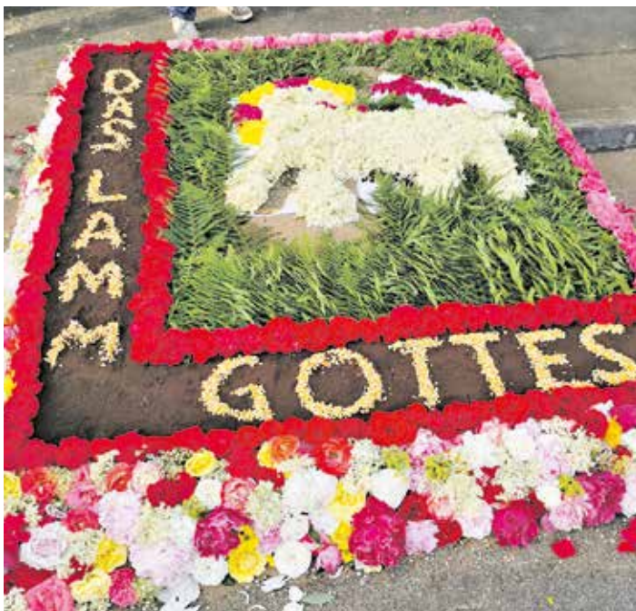
Einer der Blumenteppe des Heilig-Blut-Festes, die liebevoll von vielen Helfern in den frühen Morgenstunden gestaltet wurden.

werden Burgwindheimerinnen und Burgwindheimer in die Aufgaben des Festes mit eingebunden und sind somit seit Kindesbeinen Teil der lebenden Tradition. Neben den kirchlich-geistlichen Highlights zeigte sich das Heilig-Blut-Fest seinen Besucherinnen und Besuchern auch dieses Jahr wieder mit vielen Attraktionen für Groß und Klein: Von Marktgeschehen, über Bungee-Trampolin-Springen, einer Heilig-Blut-Fest-Rallye, bis hin zu bester Verpflegung.