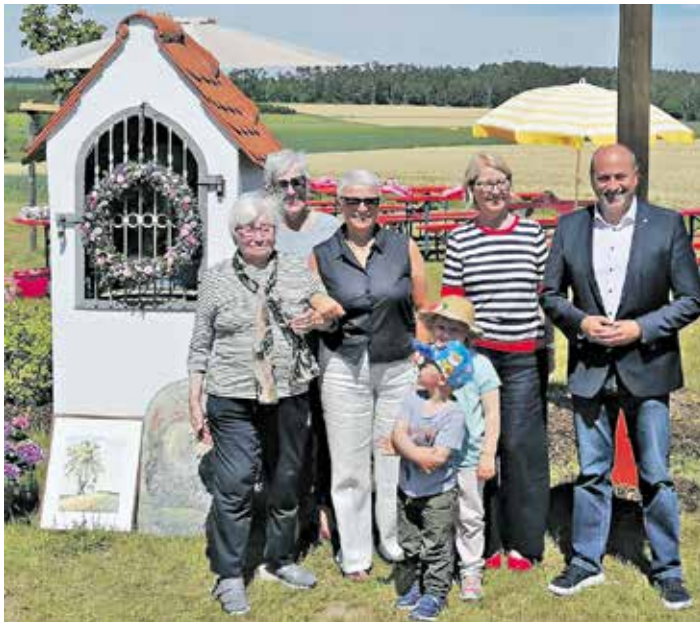
Familie Zehner mit 1. Bürgermeister Krapp.