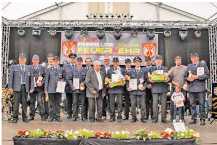
Zahlreiche Ehrungen und Auszeichnungen standen am Festprogramm auf dem Programm der Jubelwehr.