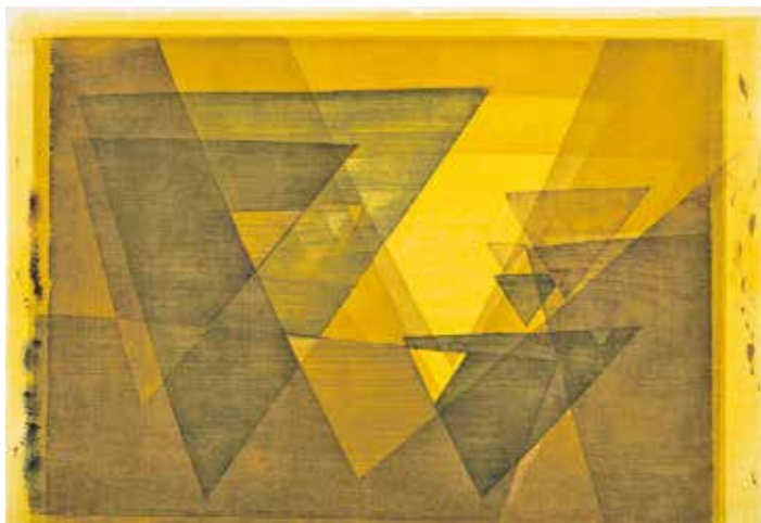
Kunstsammlungen der Diözese Würzburg.

Büchern und Schulbüchern abgebildet. Seit seinem Tod verwaltet das Diözesanmuseum Würzburg seinen Nachlass; es hat der Stephanskirche einige Werke für diese Ausstellung zur Verfügung gestellt. Trauts Werk geht in Richtung Abstraktion und hat immer auch eine spirituelle Dimension. Seine Vorstellung von Kunst war, dass der Geist Gottes, des Schöpfers der Welt, die Schöpfung durchdringt und dass es die Aufgabe und die Möglichkeit der Kunst sei, das Sichtbare, Materielle, mit dem Unsichtbaren, Geistigen in den einzelnen Werken zu vereinen. Seine Kombinationen aus Formen und Farben scheinen sich geradezu nach Gott auszustrecken – in Schönheit, Ernsthaftigkeit und einer leisen Freude und Verspieltheit. Die Ausstellung zeigt im Wesentlichen Holz- oder Linolschnitte. Sie enthält auch eine Beschreibung des Prozesses, wie solche Werke angefertigt werden.