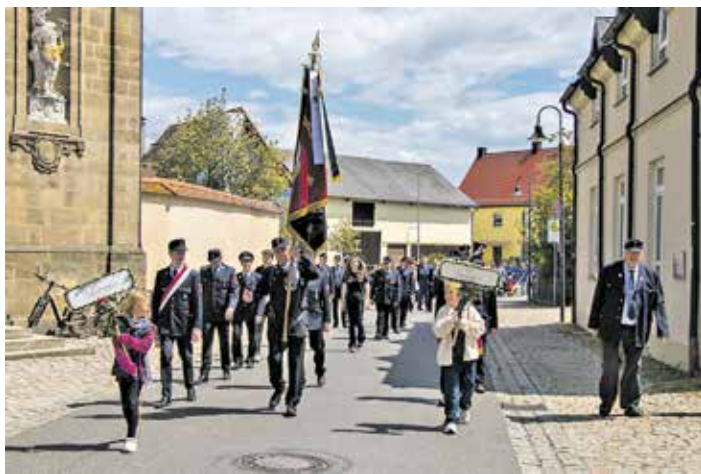
Die Jubelwehr zog stolz im Festzug durch Reundorf.

Reundorf (cr). Dank seiner Freiwilligen Feuerwehr erlebte der Frensdorfer Ortsteil Reundorf jüngst ein historisches Ereignis: Grund war das 151-jährige Gründungsjubiläum der Wehr, welches im Rahmen eines dreitägigen Festakts neben dem Sportplatz auf einem eigens errichteten Gelände begangen wurde. Nach kühlen Tagen setzte pünktlich zum Auftakt ein Wetterumschwung ein und die Coverband „Frankenräuber“ lockte zahlreiche Besucher aus Nah und Fern in das beheizte Festzelt.