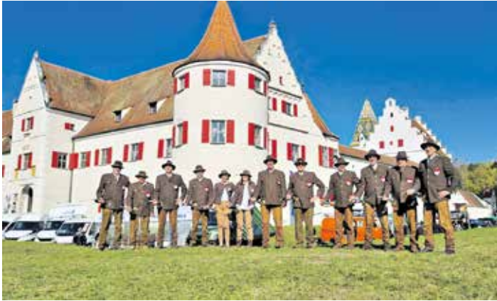
Die Steigerwälder Jagdhornbläser auf den internationalen Jagd- und Schützenfesten vor dem Schloss Grünau.

Stappenbach. Die Jagdhornbläsergruppe „Steigerwald“ ist Teil der BJV – Kreisgruppe Bamberg und blickt auf eine langjährige Tradition zurück. Ihr erster öffentlicher Auftritt fand am 8. Mai 1966 in Oberlangenstadt bei Kronach statt. Die meisten Mitglieder sind selbst passionierte Jäger, die über ihre Begeisterung für die Jagd zum Jagdhornblasen gefunden haben. Derzeit engagieren sich 12 Mitglieder am Fürst-Pless-Horn und sechs am Parforcehorn. Besonders hervorzuheben ist, dass es immer wieder gemeinsame Auftritte mit den beiden anderen Jagdhornbläsergruppen Bamberg und Ebrachthal der Kreisgruppe Bamberg gibt. Im Verlauf eines Jahres absolviert das Ensemble etwa 20 Auftritte bei den unterschiedlichsten Anlässen. Dazu zählen u.a. Hubertusmesse, Erntedank-/Straßenfeste, Einweihungen, Hegeschauen, Versammlungen, Jagdmessen, Beerdigungen, Geburtstagsfeiern, Bauern-, Martini- und Weihnachtsmärkte sowie auch auf Gesellschaftsjagden, bei denen das jagdliche Brauchtum gepflegt wird.