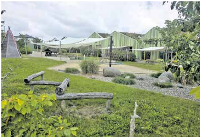
Außenanlagen der KITA St. Otto.