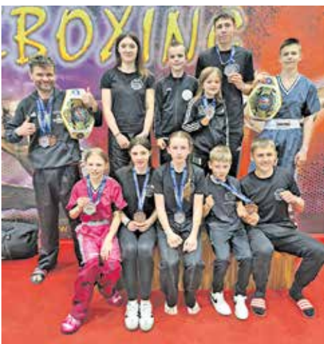
Teamfoto ISKA European Open.