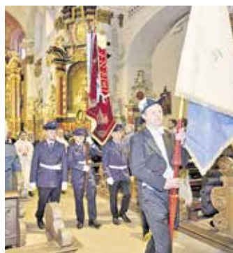
Bilder vom Gottesdienst in St. Martin.