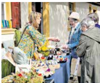
Impressionen vom Nachhaltigkeitsmarkt.

Das Spielen im Stroh, traditionelle Handwerksvorführungen wie Korbflechten sowie das Backen frischer, leckerer Hutkrapfen machten Nachhaltigkeit mit allen Sinnen erlebbar. „Fairtastisch“ zeigte eindrucksvoll, wie attraktiv und genussvoll nachhaltiges Leben gestaltet werden kann – entspannt, familienfreundlich und mitten in der Region. Die Veranstaltung ist ein Gemeinschaftsprojekt des Bauernmuseums Bamberger Land, des Bildungsbüros, der Abfallwirtschaft und der Regionalentwicklung des Landkreises Bamberg.