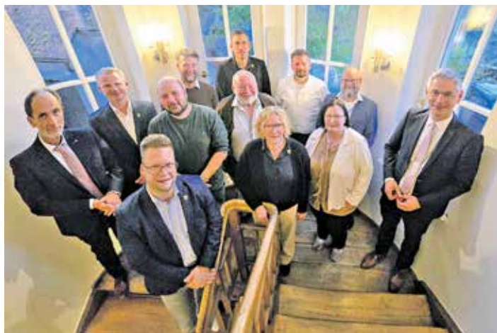
Der neue Schönbrunner Gemeinderat.

Als Vertreter der Gemeinde Schönbrunn i. Steigerwald in der Ge-