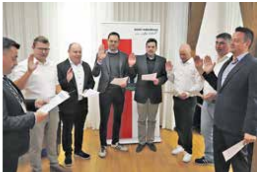
Erster Bürgermeister Peter Pfohlmann vereidigt die neuen Marktgemeinderäte.

Burgebrach (epi). In der neuen Wahlperiode (2026-2032) kamen die gewählten Mitglieder des Marktgemeinderates Burgebrach erstmals in der konstituierenden Sitzung zusammen. Zu Beginn vereidigte der Lebensälteste unter den Räten, Konrad Bischof, den neugewählten Ersten Bürgermeister Peter Pfohlmann – ein bewegender Moment nicht nur für die Räte,