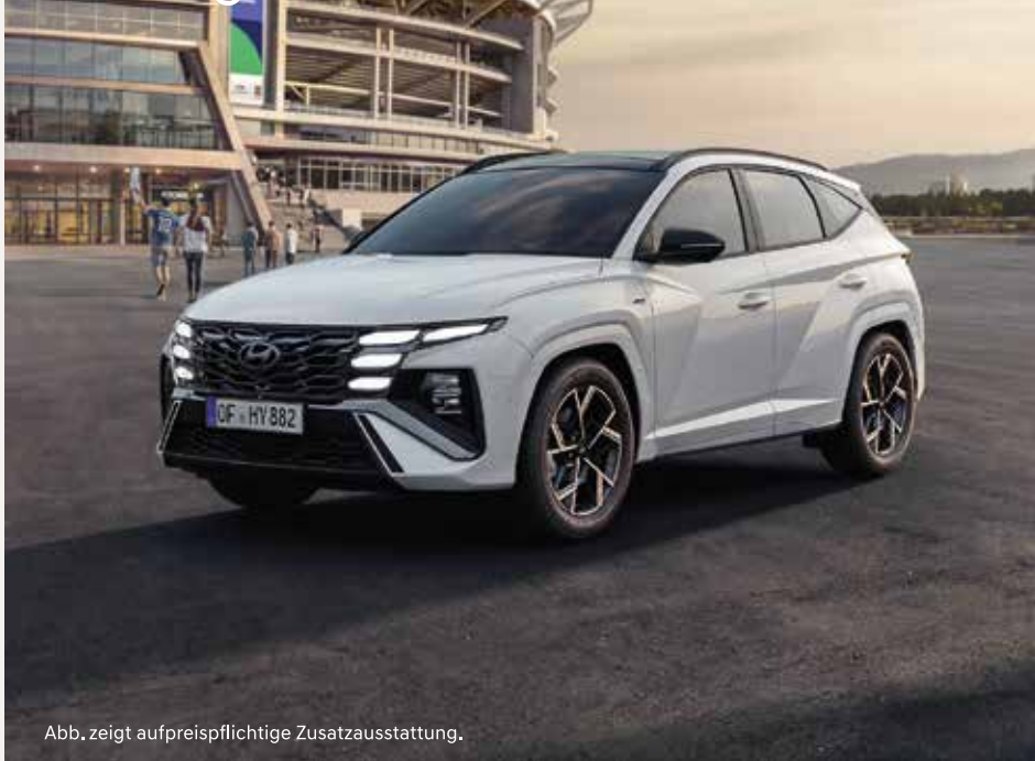
Abb. zeigt aufpreispflichtige Zusatzausstattung.

Am 10. Mai laden wir Sie herzlich zum Kirschblütenfest ein. Von 10:00 bis 17:00 Uhr erleben Sie bei uns die ganze Vielfalt moderner Mobilität und den perfekten Anstoß in den Fußball-Sommer. Entdecken Sie unsere aktuellen Hyundai Modelle hautnah. Landen Sie einen Treffer beim Fußball Dart, genießen Sie die Modenschau und das anschließende Eventshopping von Sisters - Style Your Fashion, Kinderschminken, Mittagstisch mit Schäufele, Kaffee und Kuchen. Wir freuen uns auf Sie!