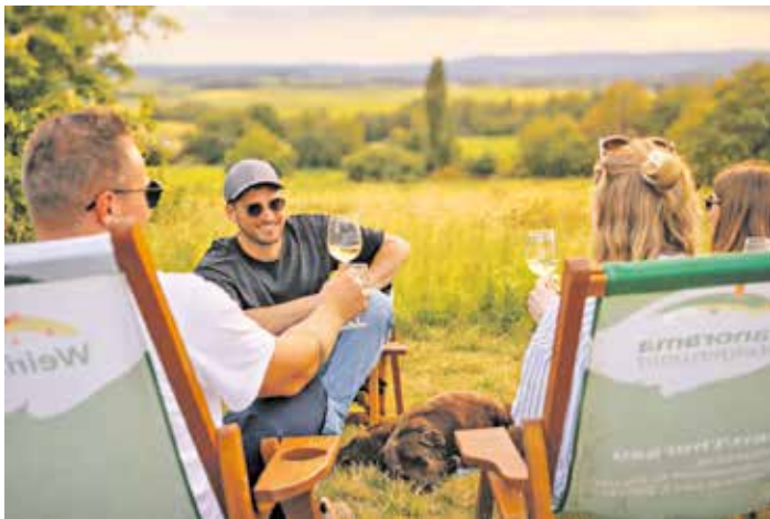
Panoramatag am Weinsteiger – Entspannte Zeit mit Freunden im Grünen.

Gerolzhofen. Am Donnerstag, 14. Mai 2026, heißt es wieder: Raus in die Natur, rein in den Genuss! Von 10:00 bis 18:00 Uhr lädt der beliebte Panoramatag am WeinSteiger dazu ein, die einzigartige Weinlandschaft des Steigerwald-Vorlandes mit allen Sinnen zu erleben. Unter dem Motto „Wandern mit Genuss“ erwartet die Besucher eine genussvolle Entdeckungsreise durch die malerischen Weinorte Oberschwarzach, Wiebelsberg, Gerolzhofen, Dingolshausen, Michelau und Hundelshausen. Entlang der Strecke locken liebevoll gestaltete Panoramapavillons, an denen Winzer und Brenner ihre besten Tropfen, regionale Spezialitäten und süße Köstlichkeiten anbieten. Ob ein Glas Frankenwein mit Weitblick, eine herzhaft Brotzeit, frisch gebackene Kuchen oder sogar ofenwarme Pizza – hier kommt jeder auf seinen Geschmack. Dabei wird jeder Halt zu einem Erlebnis: fantastische Ausblicke, entspannte