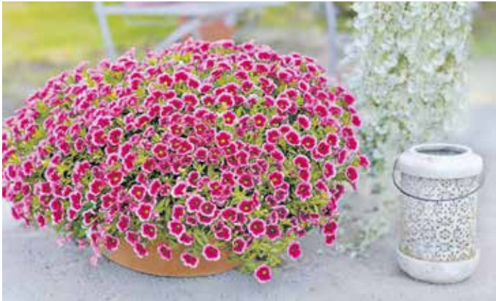
Bezaubernde Blütenwolke: Der „Feenstaub“ sorgt den ganzen Sommer über für gute Laune.

Magische Fähigkeiten – das und manches mehr wird dem „Feenstaub“ zauberhafter Märchenwesen zugeschrieben. Eine der besonderen Pflanzen ist ein ganz neues, pink-rosa gemustertes Zauberblöckchen, das die bayerischen Gärtner zur ihrer „Pflanze des Jahres 2026“ gewählt haben – und das ab dem „Tag der offenen Gärtnerei“ am 25. April 2026 in über 200 teilnehmenden Gärtnereien erhältlich ist.