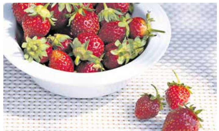
Die „Lilly Waldberry“ gedeiht als „Genuss-Pflanze des Jahre 2026“ auf dem Beet ebenso wie im Topf oder im Balkonkasten.