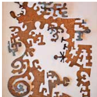
Werk: Nils Naarmann

Kunst und historischer Architektur. Jede Künstlerin und jeder Künstler hat die gezeigten Werke eigenständig ausgewählt, wodurch ein authentischer Querschnitt zeitgenössischer Positionen entsteht. Die öffentliche Vernissage findet am Freitag, 24. April um 18:00 Uhr statt. Die Ausstellung ist vom 24. April bis 10. Mai 2026 geöffnet: Freitag 14:00