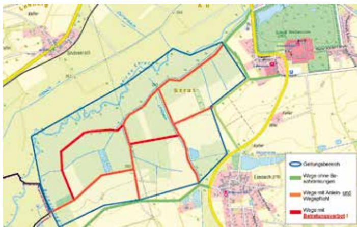
Karte des Geltungsbereichs.

Nur durch rücksichtsvolles Verhalten und gemeinsames Engagement kann dieses letzte Vorkommen des Großen Brachvogels in Oberfranken erhalten werden.