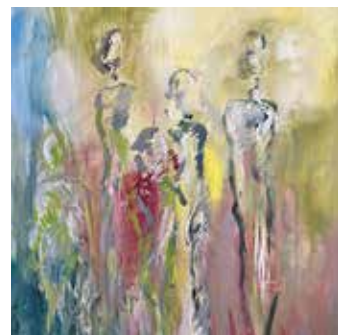
Werk: Iris Hetz

bis 18:00 Uhr, Samstag, Sonntag und Feiertage 11:00 bis 18:00 Uhr. Die Ausstellungsmöglichkeit wird durch das Landratsamt Bamberg unterstützt. Die TURM.ART IV stärkt die regionale Kunstszene und bietet Besucherinnen und Besuchern die Möglichkeit, zeitgenössische künstlerische Positionen in besonderer Atmosphäre zu erleben.