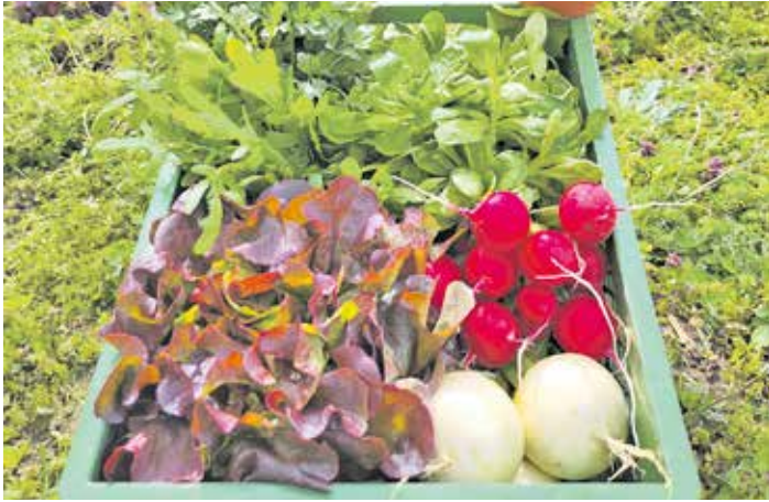
Muster einer Gemüse Abo-Kiste – mit Gemüse zusammengestellt je nach Saison.

Landkreis Bamberg. Die Öko-Modellregion Bamberger Land freut sich über das erfolgreiche erste Jahr der biozertifizierten Gärtnerei Zwiebelmoser aus Strullendorf, die beim Aufbau vom Netzwerk begleitet und unterstützt wurde. Auf rund 7.000 qm werden über 30 verschiedene Gemüsekulturen nach den Prinzipien der Marktgärtnerei angebaut. Traktoren und andere schwere Maschinen kommen nicht zum Einsatz, die Bewirtschaftung erfolgt überwiegend per Hand und mit einfachen, bodenschonenden Geräten. Das Gemüse wird über den Bamberger Bauernmarkt, die lokale Gastronomie sowie über wöchentliche Abokisten für Privathaushalte vermarktet.