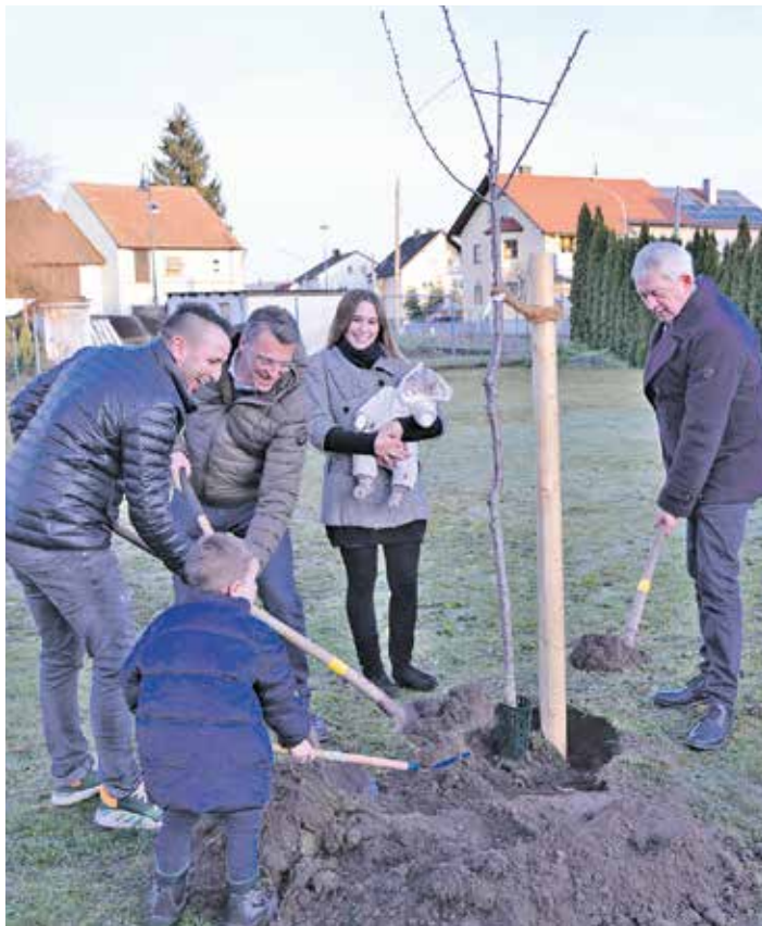
Archivbild aus 2019: Familie Maislein pflanzte mit Landrat Johann Kalb und Bürgermeister Jochen Hack den ersten Neugeborenen-Baum des Landkreises Bamberg.

Landkreis Bamberg. Die Tradition, einem Neugeborenen einen frisch gepflanzten Baum zu widmen, gilt als Ausdruck der Zuversicht, der Hoffnung auf eine gesunde Zukunft und der Feier neuen Lebens. Mit dem Projekt „Ein Baum für jedes Landkreis-Baby“ setzt der Landkreis Bamberg ein nachhaltiges Zeichen für junge Familien und die Zukunft kommender Generationen. Jedes anspruchsberechtigte Kind erhält einen hochwertigen Obstbaum, der gepflanzt und über viele Jahre hinweg wachsen kann – als lebendiges Symbol für den Start ins Leben. Ab sofort wird die Beantragung der Geburtsbäume noch einfacher: Über das neu eingerichtete Online-Formular, können die Bäume nun unkompliziert auf elektronischem Wege bestellt werden. Dort finden Interessierte auch alle wichtigen Informationen und Antworten auf häufig gestellte Fragen. Das Antragsformular ist abrufbar unter: https://www.landkreis-bamberg.de/Geburtsbaum/ . „Wir sind ein sehr vitaler Landkreis!“ – Landrat Johann Kalb freut sich, dass die Idee bisher so gut angenommen wurde. Seit 2019 wurden rund 3000 Bäume für die Neugeborenen im Landkreis Bamberg vergeben.