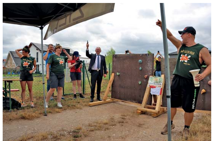
Matsch, Teamgeist und Rekorde: Eindrücke vom 1. Matschlauf 2024.