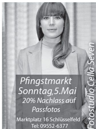
Fotostudio Cella Seven

Öffnungszeiten: Mo-Fr: 08:30-12:30 Uhr; 14:00-18:00 Uhr Sa: 08:30-12:30 Uhr www.die-brille-optik-amann.de