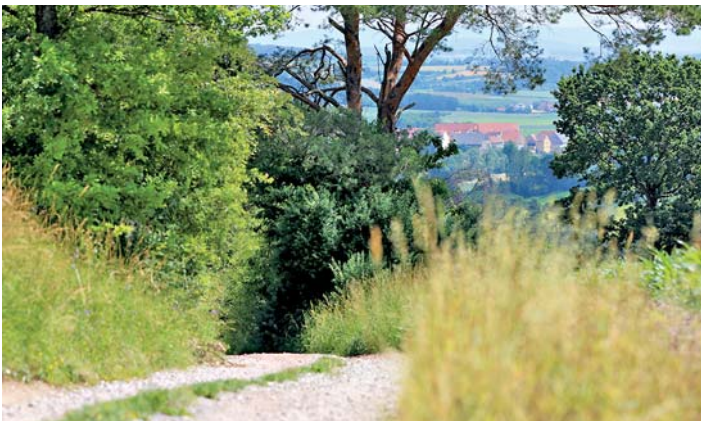
Wanderweg im Steigerwald: Burgwindheim.

der Mainhalbinsel Limbach ein. In Vestenbergsgreuth hat die als „Naturpark-Kita“ ausgezeichnete Kita „Greuther Wichtel“ ihre Türen geöffnet und bietet ein Entdeckerspiel und Kaffee und Kuchen. Mit dem Steigerwaldklub kann von Bamberg nach Tütschgereuth gut 18 km auf dem Steigerwald-Panoramaweg gewandert werden und in Prichsenstadt führt das Bioweingut Ruppert durch den Lebensraum Bioweinberg mit anschließender Verkostung. Bereits am Vortag, 17. Juni 2023, findet um 16 Uhr eine sommerliche Exkursion auf dem Streuobst-Erlebnisweg in Markt Herrnsheim (Willanzheim) statt. Auch die Naturpark-Ranger bieten im Rahmen des Naturparktags eine Führung an. Um 10.15 Uhr geht es von Donnersdorf-Falkenstein (Treffpunkt: Jugendzeltplatz) hinauf zum Zabelstein, wo einige Projekte des Naturparks Steigerwald vorgestellt werden und bei einem Umtrunk gemeinsam der Naturparktag gefeiert werden kann. Für einige der Veranstaltungen ist vorab eine Anmeldung erforderlich. Das Programm ist zu finden unter www.steigerwald-naturpark.de/naturparktag .