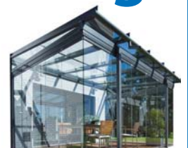
mit Faltwänden aus Glas