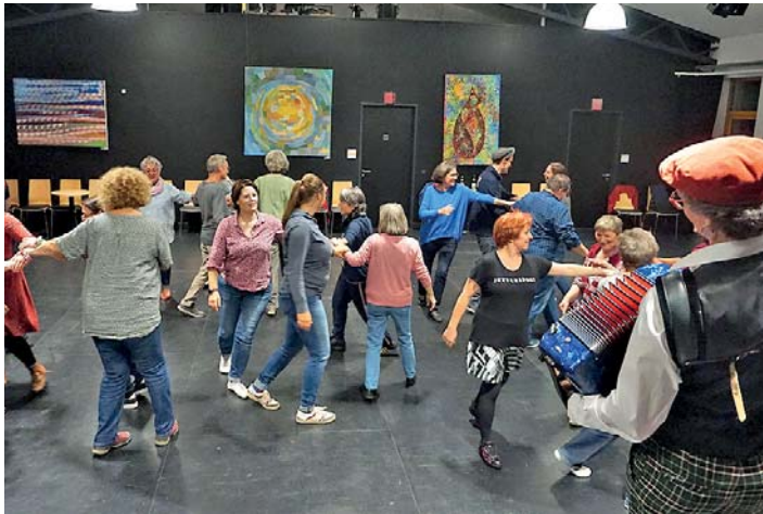
Der Tanzkurs „Tanzfabrik“ erfreut sich großer Beliebtheit in der KUFA.

Weitere Termine: 12. Juli 2023, 13. September 2023, 11. Oktober 2023 und 15. November 2023. Der Tanzkurs muss komplett gebucht werden. Es ist ein frei wählbarer Teilnehmer-Beitrag zwischen 25 und 75 Euro zu entrichten. Der Beitrag kann auf das Konto bei der Sparkasse Bayreuth Kontoinhaber: Bayerischer Landesverein für Heimatpflege e.V., Verwendungszweck: TanzFabrik Block II, IBAN: DE83 7735 0110 0020 6601 63, BIC: BYLADEM1SBT, überwiesen oder am ersten Abend in bar an der Einlasskasse bezahlt werden. Begleitpersonen sind bei „B“ im Behindertenausweis frei. Weitere Infos gibt es auf www.kufa-bamberg.de .