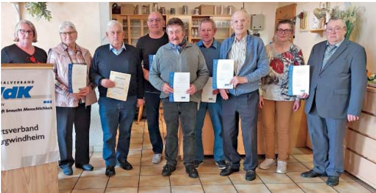
Zahlreiche Mitglieder wurden für ihre Treue zum VdK bei der Versammlung ausgezeichnet.