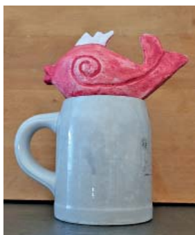
und auch fränkisch inspirierte Objektkunst. Landläufig verbindet man Bier, Karpfen und fränkischen Rechen mit der Region Franken.