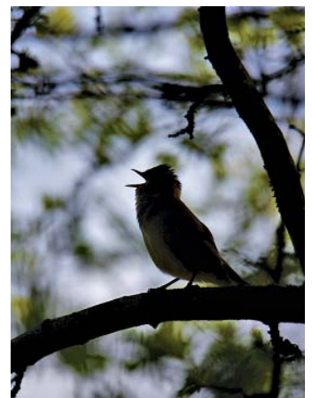
Singende Nachtigall auf der Erba-Insel.

Bamberg. Unter dem Motto „Was man kennt, das schützt man – Artenkenner in der Region Bamberg“ setzt der BUND Naturschutz sein Umweltbildungsprojekt zur Förderung und zum Erhalt der Artenkenntnis auch im Jahr 2023 und 2024 fort. Seit Projektbeginn im Frühjahr 2020 nahmen insgesamt über 250 naturinteressierte Erwachsene an 18 Kursen teil und beschäftigten sich dabei mit der Bestimmung von Amphibien, Faltern, Fledermäusen, Insekten, Pflanzen, Pilzen und Vögeln. Damit tiefer in die jeweilige Materie eingetaucht werden kann, besteht jeder Kurs aus einer theoretischen Einführung und 3-5 Exkursionen im Landkreis Bamberg. Ab sofort können sich Interessierte auf der Webseite des BUND Naturschutz Bamberg unter https://bamberg.bund-naturschutz.de/artenkennerprojekt näher informieren und zu den Kursen anmelden.