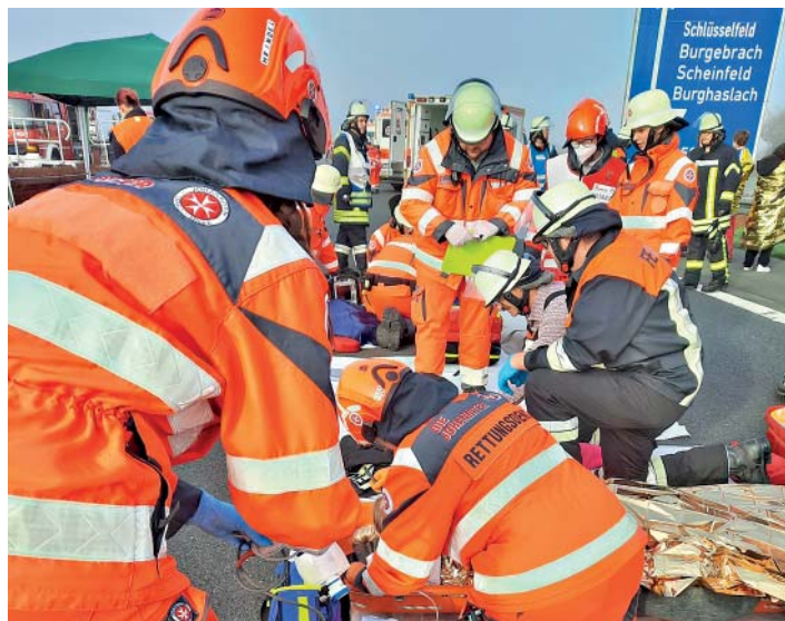
Freiwilliges Engagement: Neben ihren Einsätzen absolvieren die Ehrenamtlichen auch Übungen wie hier auf der Autobahn bei Schlüsselfeld.