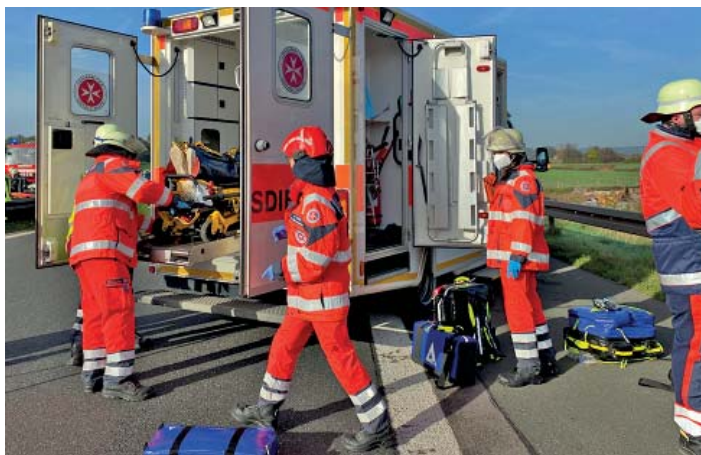
Mehr als 3.500 Stunden leisteten die Ehrenamtliche der oberfränkischen Johanniter alleine im Bereich Bevölkerungsschutz, hier bei einer Großübung.

entscheidend. Hier wie in der Pflege gilt: Die Wertschätzung für diese Berufe muss weiter steigen und die Aus- und Fortbildungsangebote ausgebaut werden“, so Jürgen Keller. Auch der Bedarf an Schulbegleitern, die Kinder mit körperlicher, geistiger oder seelischer Behinderung beim Besuch einer Regel- oder Förderschule unterstützen, wächst stetig.