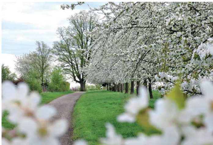
Blühende Streuobstwiese in Bamberg.

Voraussetzung ist, dass die Bäume eine Stammhöhe von 180 cm haben, es sich um wurzelnackte Bäume oder Ballenpflanzen handelt und der Baum am besten