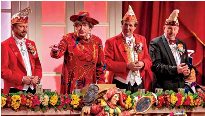
Mariechen (Volker Heißmann 2. von links) als Sitzungspräsidentin mit dem Elferrat.

Die Fastnacht ist zurück! Eine gute Gelegenheit, um die bayerische Prominenz aus Kirche, Politik und Gesellschaft sowie die Crème de la Crème der fränkischen Fastnacht-Szene wieder nach Veitshöchheim einzuladen. 2023 dürfen sich die Gäste im Saal und die Zuschauer vor den Fernsehern auf eine spannende und mitreißende Prunksitzung in bewährter Manier freuen – ohne Pandemie, dafür mit ganz viel Spaß! Die „Fastnacht in Franken“ präsentiert dreieinhalb Stunden Tanz, Musik und Büttreden vom Feinsten aus den Veitshöchheimer Mainfrankensälen. Da wird den Großen und Mächtigen im Land der Spiegel vorgehalten und mit Witz und Humor die Weltlage kommentiert. Bekannte Fastnacht-Stars wie der Kabarettist „Dreggsagg“ Michl Müller, der Bauchredner Sebastian Reich mit Nilpferddame Amanda, das Komödianten-Duo Volker Heißmann & Martin Rassau und die Altneihäuser Feuerwehrkapell'n geben der Sitzung eine besondere Würze. Dazu tanzen die besten Garden und Tanzmariechen, die zu Deutschlands Spitze gehören. Die Kultsendung steht für Unterhaltung auf höchstem Niveau. Seit 1987 wird die „Fastnacht in Franken“ live ausgestrahlt und ist im BR Fernsehen seit den 1990er-Jahren die erfolgreichste Sendung überhaupt.