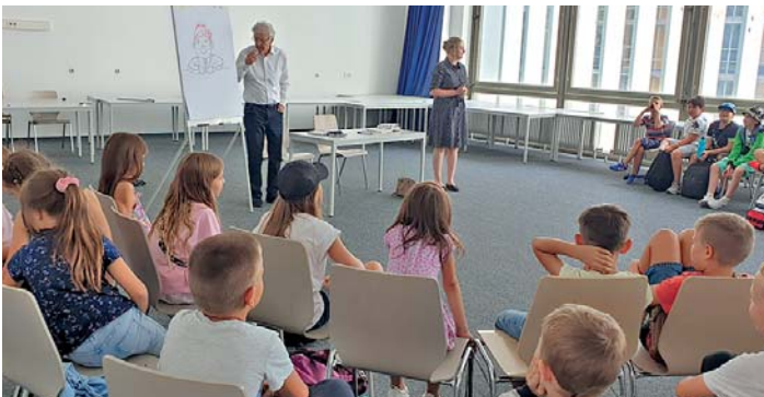
Paul Maar besuchte mit dem Sams ukrainische Kinder.

Das Projekt wird in Kooperation mit „Freund statt Fremd“ durchgeführt. Dazu wurden in der CariThek zwei Teilzeitstellen geschaffen. Ihre Aufgabe besteht darin, Organisationen miteinander zu vernetzen und die Angebote für die Kinder und Jugendlichen bekannt zu machen und zu vermitteln. Ermöglicht hat dies eine Förderung der Aktion Mensch in Höhe von 56.000 Euro. Bereits zu Beginn des einjährigen Projektes konnte im August ein besonderes Angebot umgesetzt werden. In Ergänzung der Sommerschule für ukrainische Kinder wurde drei Wochen lang ein Freizeitprogramm konzipiert und durchgeführt. So konnten knapp 100 Kinder im Alter zwischen 6 und 18 Jahren die Stadt Bamberg und die deutsche Sprache etwas besser kennenlernen. Vom Foto-Workshop über Bastel- und Sportangebote bis zur Stadtrallye, in der sie die Altstadt erkundeten, konnten die Kinder und Jugendlichen sich in vielen Bereichen ausprobieren. Ein besonderes Highlight war der Besuch von Paul Maar. Weil das Sams als erstes ins Ukrainische übersetzt worden ist, kannten einige Kinder die Geschichte bereits und konnten begeistert ihr Wissen teilen. Wer sich gerne mit Kindern beschäftigt und sich im Projekt engagieren will, kann sich mit einer Mail wenden an: ukraine@caritas-bamberg.de .