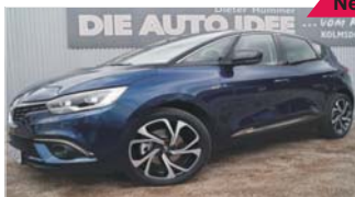
Renault Scenic IV Bose-Edition „Kamera - Sitzheizung - LED“

EZ: 05/2019, 50 Km, Diesel, 88 kW (120 PS), Teilleider, ZV mit Funk, Navi, Tempomat, Licht- u. Regensensor, DAB