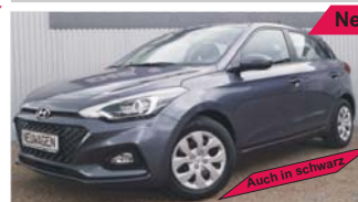
Hyundai i20 1.2 „Navi - Kamera - Sitzheizung“

EZ: 04/2019, 250 Km, Benzin, 62kW (84 PS), Tempomat, Lenkradheizung, Klimaanlage, Radio/USB/Bluetooth