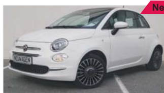
Fiat 500 1.2 Lounge „Klimaautomatik - PDC - Tempomat“

EZ: 06/2019, 50 Km, 51 kW (69 PS), Benzin, el.Fensterheber, Bluetooth, ZV mit Funk, Panoramadach, Tagfahrlicht