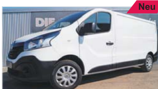
Renault Traffic Kasten L2H1 3,0 „Navi - Klima - PDC - AHK“

EZ: 05/2019, 50 Km, Diesel, 88 kW (120 PS), Radio/Bluetooth, Holzboden, el. Fensterheber, Hecktüren