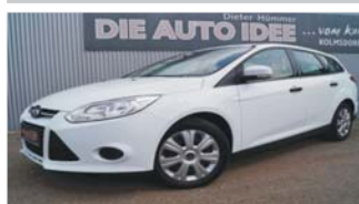
Ford Focus Turnier Ambiente „Klima - Bluetooth - Radio/CD“

EZ: 01/2014, 91.900 Km, Benzin, 74kW (100 PS), elektr. Außenspiegel beheizt, elektr. Fensterheber, Isofix, ASB, ESP