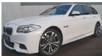
BMW 535d xDrive Touring „M-Sportpaket - Automatik - Leder“

EZ: 07/2013, 103.500 Km, Diesel, 230 kW (313 PS), Klimaautomatik, Tempomat, Navi, Heckscheibe abgedun.