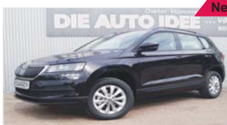
Skoda Karoq Ambition „Navi - PDC - Sitzheizung“

EZ: 08/2019, 50 Km, Benzin, 110kW (150 PS), Licht-u.Regensensor, DAB, Licht- u. Regensensor, Bremsassistent