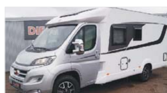
Bürstner Nexxo Time 660 „AHK - Navi - Tempomat“

EZ: 06/2016, 1.800 Km, Diesel, 96 kW (131 PS), Navi, Klimaanlage, WC, separate Dusche, Festbett, ABS, ESP