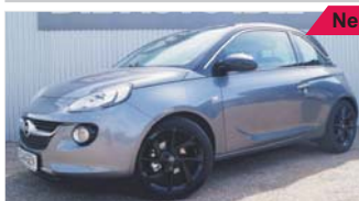
Opel Adam Jam „Intellilink - PDC - Sitzheizung“

EZ: 06/2019, 50 Km, Benzin 74kW (101 PS), Touchscreen, Klimaanlage, Lenkradheizung, Alufelgen