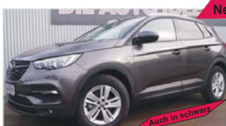
Opel Grandland X 1.2 „Navi - Kamera - Autmatik“

EZ: 01/2019, 50 Km, Benzin, 96 kW (131 PS), Spurhalteassistent, Isofix, Tempomat, Bluetooth, Klimaautom.