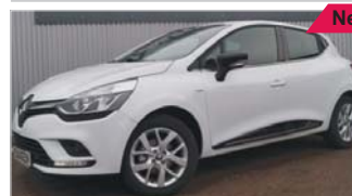
Renault Clio IV Limited „Navi - PDC - Alu - Tempomat“

EZ: 08/2019, 50 Km, Benzin, 56 kW (76 PS), Bluetooth, Isofix, Zentralverriegelung Heckscheibe abgedunkelt