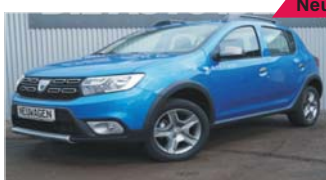
Dacia Sandero II Stepway „Prestige - Navi - PDC - Tempomat“

EZ: 03/2019, 50 Km, Benzin, 66 kW (90 PS), Klima, Bluetooth, Radio, Touch- screen, Nebelscheinwerfer, Tagfahrlicht