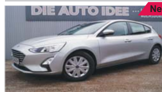
Ford Focus Trend 1.0 „Sitzheizung - Tempomat - PDC“

EZ: 08/2018, 50 Km, Benzin, 74 kW (101 PS), Spurhalteassistent, ZV mit Funk, Tagfahrlicht, Bluetooth