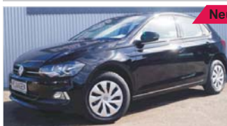
VW Polo VI Comfortline „Klima - Sitzheizung - Bluetooth“

EZ: 08/2018, 50 Km, Benzin, 70kW (95 PS), Isofix, MP3/Radio, Nebelscheinwerfer, elektr. Fensterheber