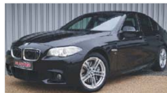
BMW 528i xDrive „M-Paket - Standheizung - Bluetooth“

EZ: 02/2015, 91.000 Km, Benzin, 180 kW (245 PS), Schiebe-/Hebedach, Sitzheizung vo, Tempomat, Navi, CD