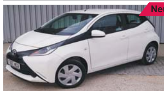
Toyota Aygo X 1.0 „Klima - USB - 4 Jahre Garantie“

EZ: 01/2019, 50 Km, Benzin, 53 kW (72 PS), Tagfahrlicht, AUX-In, Radio, el. Fensterheber vo, 4-Sitzer, Isofix