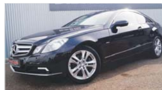
Mercedes-Benz E250 Coupe CGI „Automatik - Xenon - Navi“

EZ: 09/2009, 124.500 Km, Benzin, 150 kW (204 PS), Sitzheizung vo, Radio, Tempomat, Bluetooth, Einparkhilfe hi+vo