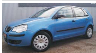
VW Polo IV Tour „Klimaautomatik - Sitzheizung“

EZ: 11/2007, 148.500 Km, Benzin, 59kW (80 PS), PDC, Radio/CD, ZV, Tempomat, el. Fensterheber