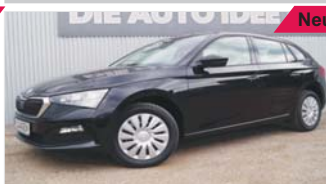
Skoda Scala Ambition „LED - Sitzheizung - Klima“

EZ: 07/2019, 50 Km, Benzin, 85kW (116PS), Tempomat, ZV mit Funk, Radio, Bluetooth, Bremsassistent, Sportsitze