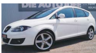
Seat Altea XL Sport „Sitzheizung - Klimaautomatik“

EZ: 06/2009, 114.800 Km, Benzin, 92 kW (125 PS), Radio/MP3, Tempomat, Klimaautom., Einparkhilfe hi, el. Spiegel