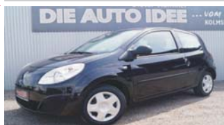
Renault Twingo Authentique „Klima - Klima - Radio“

EZ: 09/2007, 103.500 Km, Benzin, 43kW (58PS), Isofix, ZV mit Funk, Wegfahrsperr, el. Fensterheber