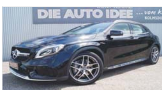
Mercedes-Benz GLA AMG „4matic - Panoramadach - Navi“

EZ: 08/2017, 32.900 Km, Benzin, 280 kW (381 PS), Teilleider, Klima, Sitz- heizung, Schiebe-/Hebedach, Allrad