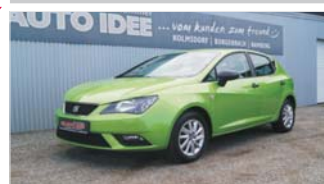
Seat Ibiza Lim. Reference „Klima - Bluetooth“

EZ: 07/2016, 25.650 Km, Benzin, 66 kW (90 PS), Radio, Nebelscheinwerfer, ABS, ESP, el. Fensterheber, Isofix