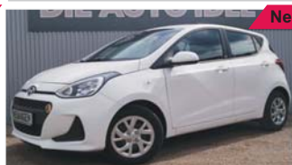
Hyundai i10 „Klima - USB - Tagfahrlicht“

EZ: 07/2019, 50 Km, Benzin, 49 kW (67 PS), ZV mit Funk, el. Fensterheber, Rücksitzbank teilbar, Isofix, Radio