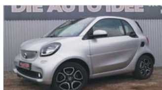
Smart ForTwo coupe Prime „Navi - Kamera - Automatik“

EZ: 06/2018, 9.200 Km, Benzin, 66 kW (90 PS), Panoramadach, Bluetooth, el. Außenspiegel, Sitzheizung, Radio