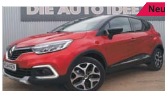
Renault Capture Intens Tce150 „Automatik - LED - Navi - Kamera“

EZ: 02/2019, 50 Km, Benzin, 110 kW (150 PS), Tempomat, USB, elektr. Wegfahrsperr, Keyless Entry