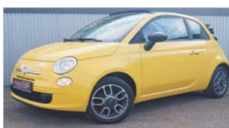
Fiat 500 Cabrio Pop „Klima“

EZ: 07/2010, 113.900 Km, Benzin, 51kW (69 PS), Einparkhilfe hi, Zentralverriegelung, Radio/CD, Isofix