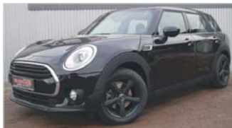
Mini Cooper Clubman „LED - Navi - Sitzheizung“

EZ: 10/2016, 26.400 Km, Benzin, 100 kW (136 PS), Tempomat, LED, Sportlenkrad, Radio/CD, Bluetooth