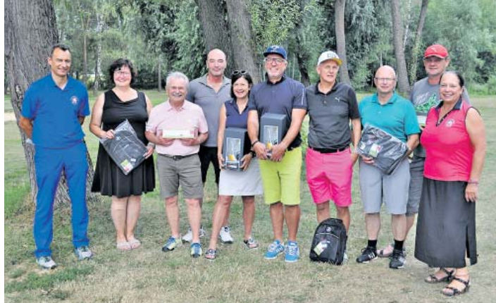
Das Bild zeigt die Gewinner des Benefizturniers.