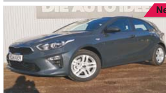
Kia Ceed 1.4 „Klima - Bluetooth - Alu“

EZ: 02/2019, 50 Km, Benzin, 73kW (99PS), Spurhalteassistent, Isofix, ESP, Tempomat, Lichtautomatik