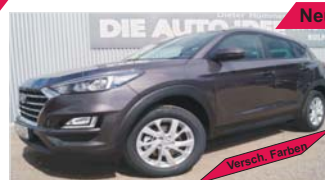
Hyundai Tucson 1.6 GDI „Navi - Kamera - DAB - Sitzheizung“

EZ: 04/2019, 50 Km, Diesel, 97 kW (132 PS), Tempomat, Radio/AUX, PDC hinten und vorne, Nebelscheinwerfer