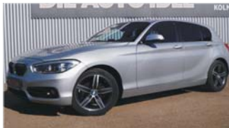
BMW 116d Sport Line „Automatik - Navi - LED“

EZ: 06/2016, 49.500 Km, Diesel, 85 kW (116 PS), Radio/CD, el. Spiegel, Klimaut., Licht-u.Regensensor, ESP