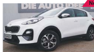
Kia Sportage 1.6 T-GDI „Navi - Kamera - Sitzheizung“

EZ: 04/2019, 250 Km, Benzin, 130 kW (177 PS), ZV mit Funk, Lichtsensor, Radio, Alarmanlage, Bluetooth, Tempomat