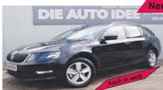
Skoda Octavia Combi Ambition „Navi - PDC - Sitzheizung“

EZ: 03/2019, 50 Km, Benzin, 110kW (150 PS), Klima, Bluetooth, Radio/USB, Außenspiegel beheizbar, Tagfahrlicht