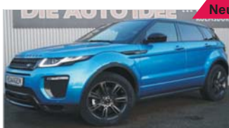
Land Rover Evoque Edition „Leder - Panoramadach - Automatik“

EZ: 08/2018, 50 Km, Diesel, 132 kW (179 PS), Sitzheizung vo, Tempomat, Navigation, Bluetooth, Allrad, USB/AUX