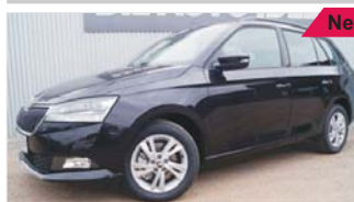
Skoda Fabia Combi Style „LED - Kamera - Klimaautomatik“

EZ: 03/2019, 50 Km, Benzin, 81kW (110 PS), Sitzheizung vo., Isofix, ESP, Lichtautomatik, Radio, Bluetooth