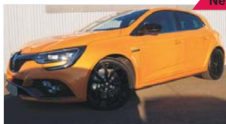
Renault Megane IV RS „LED - Kamera - Navi - 19“ Alu“

EZ: 02/2019, 50 Km, Benzin, 205kW (279 PS), Tempomat, Radio/USB, Tempomat, Sportlenkrad, el.Parkbremse