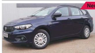
Fiat Tipo SW 1.4 Pop „Klima - USB - ZV“

EZ: 01/2019, 50 Km, Benzin, 70kW (95 PS), ESP, AUX, Nebelscheinwerfer, Isofix, Dachreling, elektr. Wegfahrsperr