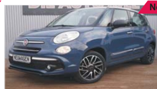
Fiat 500L Mirror „DAB - Klima - PDC - Bluetooth“

50 km, Benzin, 70 kW (95 PS), Tempomat, Radio, Isofix, Nebelscheinwerfer, 6-Gang, Zentralver.