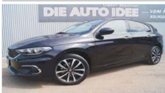
Fiat Tipo Automatik Lounge „Navi - Kamera - Sitzheizung“

EZ: 03/2017, 7.700 Km, Benzin, 81kW (110 PS), Sicht-Paket, ZV mit Funk, Klimaautomatik, el. Fensterheber, ESP