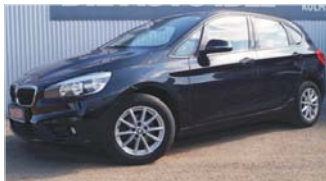
BMW 218 d Active Tourer „Avantgarde - Navi - Automatik“

EZ: 03/2016, 52.500 Km, Diesel, 110kW (150 PS), Bremsassistent, Licht- und Regensensor, Klimaautomatik